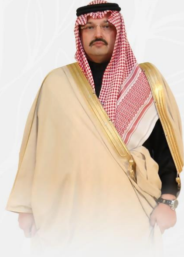
أمير منطقة عسير صاحب النمو الملكي

التقدم والرقي يُصنع بأيدي أبنائه المخلصين بتقديم ما بوسعهم من جهود للتطوير في ظل الرؤية الثاقبة من لدن القيادة الحكيمة لرفعة الوطن ورقيه .