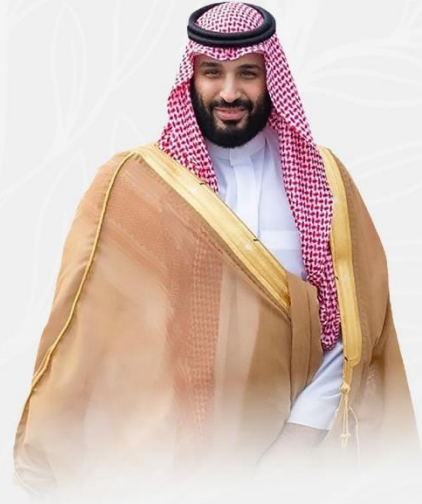
صاحب السمو الملكي الأمير

نهدف للوصول إلى قطاع غير ربحي مهم مبادر وداعم ومؤثر في التعليم والصحة والثقافة والمجالات البحثية