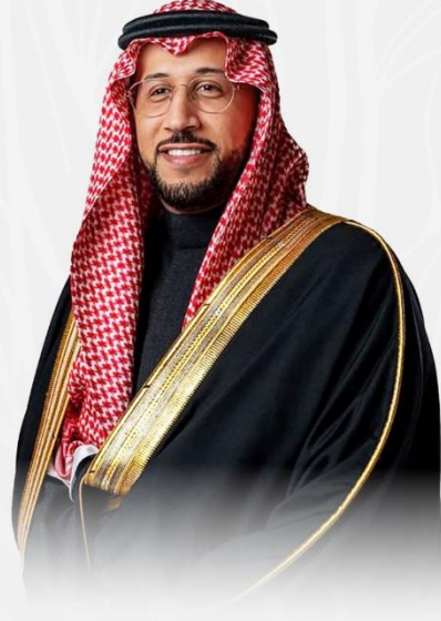
صاحب السمو الملكي الأمير خالد بن سطاتم بن سعود بن عبدالعزيز آل سعود نائب أمير منطقة عسير